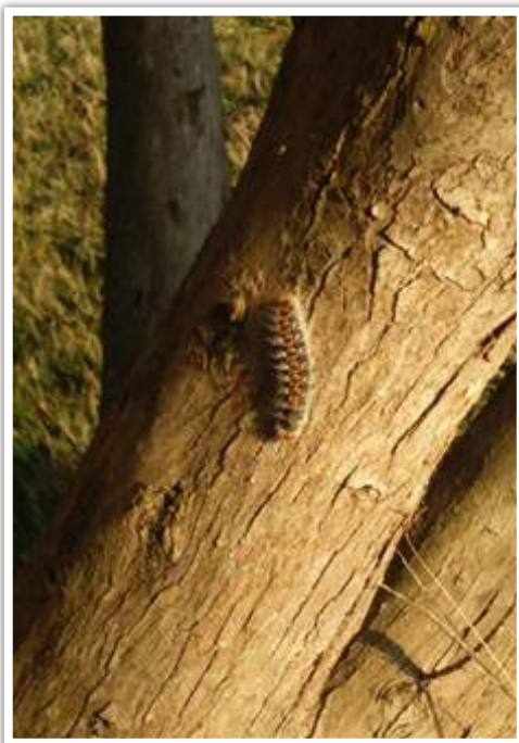
Chenille processionnaire du pin (stade L5) isolée sur un tronc de cyprès Finistère Sud, février 2018