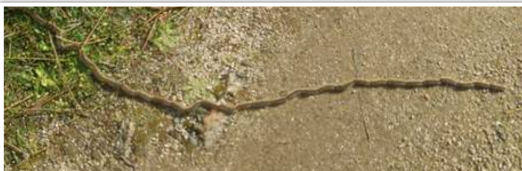
Procession bien visible sur un chemin – Finistère sud, février 2018