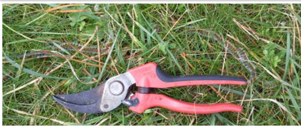
Discrète procession dans un gazon – Finistère sud, février 2018