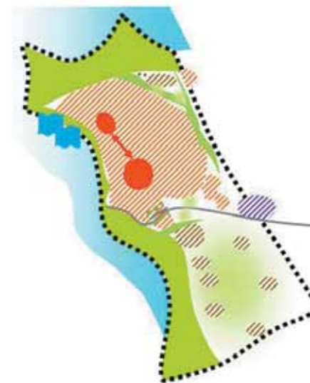
Schéma des grands enjeux économiques et des grandes zones du territoire communal